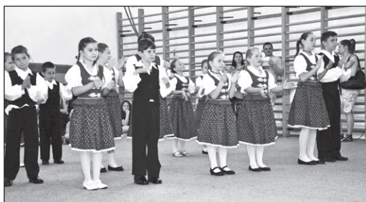
A néptánc: kultúra, mozgás, szórakozás

Miért fontos ez? Településünk önállóvá válása után gyakorlatilag nulláról kellett felépíteni egy olyan stabil, ám folya-