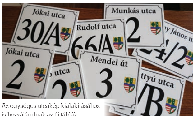
Az egységes utcakép kialakításához is hozzájárulnak az új táblák