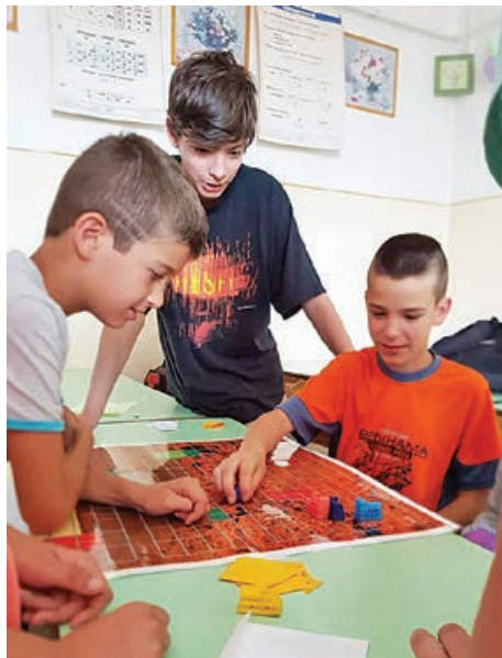
Saját tervezésű társasjátékkal játszanak a gyömrői iskolások