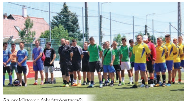
Az emléktorna felnőtt résztvevői

Az emléktornára nyolc felnőttcsapat nevezett, a mérkőzések estébe nyúlóan tartot-