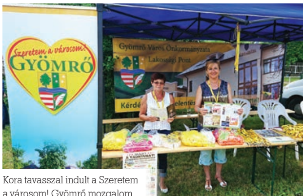
Kora tavasszal indult a Szeretem a városom! Gyömrő mozgalom