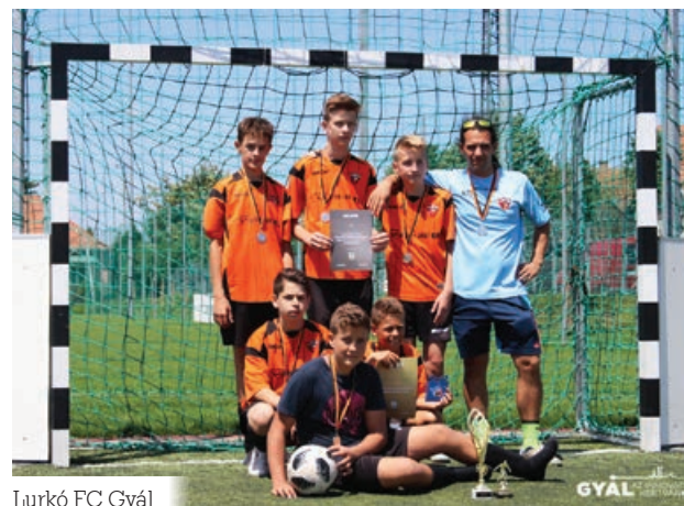
Lurkó FC Gyál