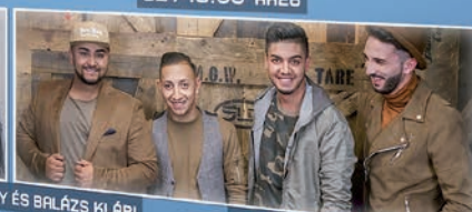
SZ / 22:30 HAM KO HAM

Motoros találkozó és felvonulás | Break tánc show | Live graffiti bemutató | Testünk a csoda interaktív kiállítás | Nyereményjáték Generation of Legends bemutató | Audi találkozó és felvonulás | Kézműves termékek Western kaszkadőr show | Fényzsonglőrök | Utcából a Prestige Banddel Játssz házzal | Baleseti szimuláció | Zöldség- és gyümölcs szobrászat Kiállítások | Retro Disco | Extreme hinta, vidámpark | Véradás