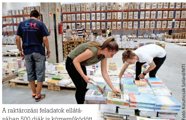
A raktározási feladatok ellátásában 500 diák is közreműködött

Rétvári Bence hangsúlyozta: az intézmények könyvellátása gördülékeny és hatékony és jól működő rendszer. Kiemelte, az állami tankönyvellátás tette lehetővé, hogy az elsőtől a kilencedik évfolyamig minden, összesen több mint egymillió diák ingyenesen kapja meg a tankönyveket. Kérdésre válaszolva közölte: évfolyamtól függően a családok 10-12 ezer forintot spórolhatnak meg diákon-