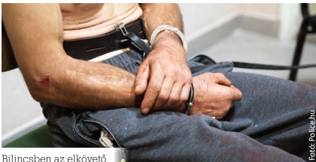
Bilincsből az elkövető