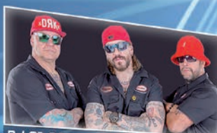
P / 21:30 GANKSTA ZOLEE ÉS A KARTEL