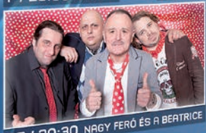
SZ / 20:30 NAGY FERŐ ÉS A BEATRICE