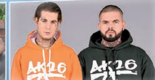
SZ / 18:00 AK26