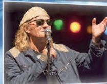
P / 20:00 CHARLIE