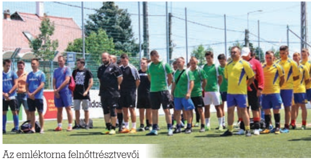
Az emléktorna felnőtt résztvevői

Az emléktornára nyolc felnőttcsapat nevezett, a mérkő-