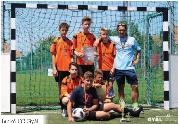
Lurkó FC Gyál

zések estébe nyúlóan tartottak, a döntőt a Green Go FC és a Los Amigos játszotta. Utóbbi örülhetett a végén, a Los Amigos 5-3-ra nyerte a mérkőzést, ezzel másodszor vihette haza a torna serlegét. A gól-